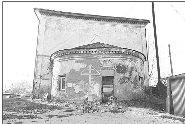
Памятный крест у алтаря Ильинской церкви

Многое уже сделано. Много ещё предстоит сделать, есть куда силы и руки приложить. Конечно, всё это возможно лишь при помощи прихожан