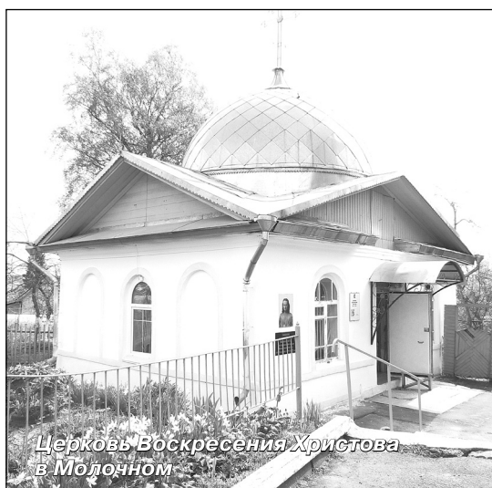
Церковь Воскресения Христова в Молочном