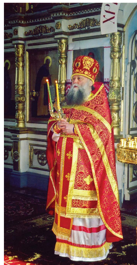
▲ В Андреевском храме