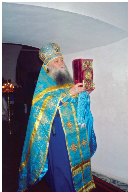
▲ Протоиерей Георгий Иванов

– Ну, рыжий, давай сюда портфель и ступай с Богом, спасибо, что помог, – ласково, но строго говорит ему о. Георгий, забирая портфель. Мальчишка испуганно отдает сумку и что есть сил тикает, видимо, к своему дому, чтобы рассказать, что поп приехал.