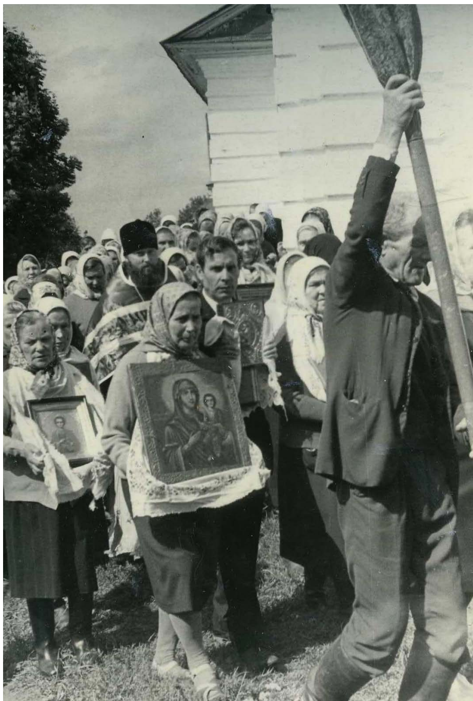
▲ Крестный ход вокруг Покровского храма близ Кириллова. 70-е годы XX века